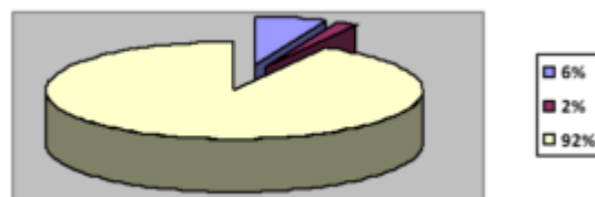
Рисунок 2. Результаты теста коммуникативных умений

Указанные модальности культуры педагога могут носить в общении имидже определяющую нагрузку, либо дополняющую имидж педагога, либо являться фоном его педагогического общения. Устойчивую взаимосвязь имиджевых характеристик общения и деятельности педагога с его культурой можно определить при помощи теста коммуникативных умений Л. Михельсона, который предлагается в переводе и адаптации Ю.З. Гильбуха.